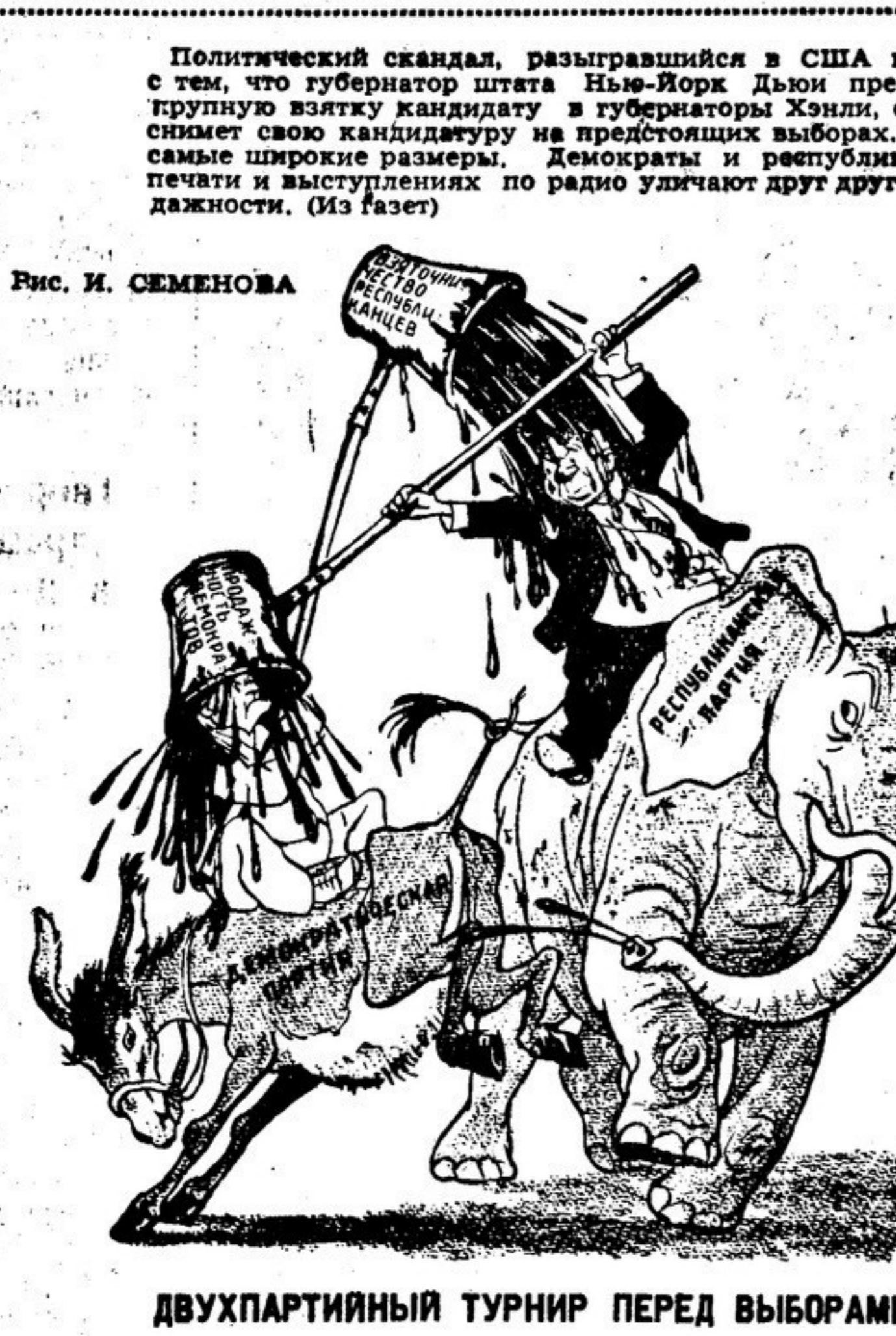
ДВУХПАРТИЙНЫЙ ТУРНИР ПЕРЕД ВЫБОРАМИ

Политический скандал, разгоревшийся в США в связи с тем, что губернатор штата Нью-Йорк Дьюи предложил групповую заявку кандидату в губернаторы Хэнли, если тот снимет свою кандидатуру на предстоящих выборах, принял самые широкие размеры. Демократы и республиканцы в печати и выступлениях по радио уличают друг друга в продажности. (Из фазет)