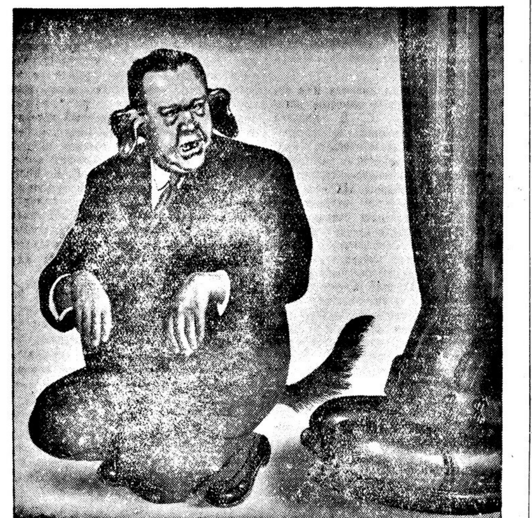
Трюгве Ли служит...

Время, вперед! — вот девиз передовиков труда Румынии, вдохновленных примером и опытом советских людей, стремящихся достойно отметить 33-ю годовщину Великой Октябрьской социалистической революции.